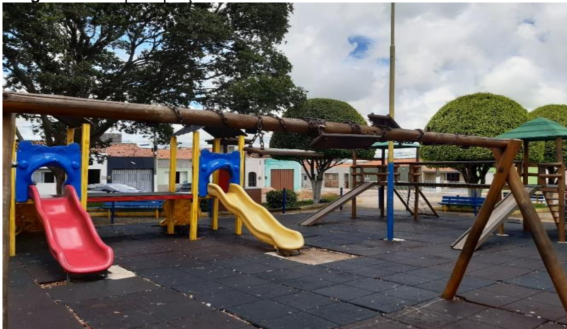
Imagens 7: Brinquedopraça

A brinquedopraça e um equipamento que fica localizada em uma praça de grande visibilidade na cidade, foi construída através do Programa Mais Infância, sendo destinada às crianças menores para o desenvolvimento de suas capacidades físicas, psicológicas e cognitivas através do brincar.