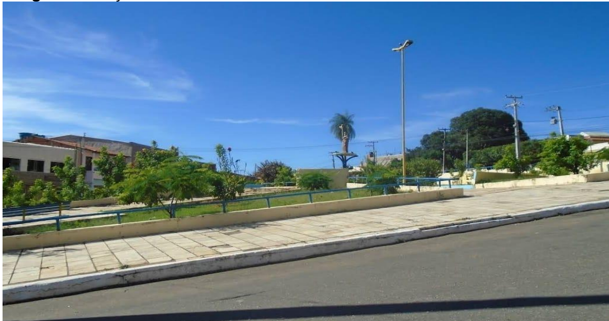
Imagem 3: Praça São Pedro

podação das árvores e plantação de outras, além de reparos em alvenaria e recuperação dos bancos e pinturas.