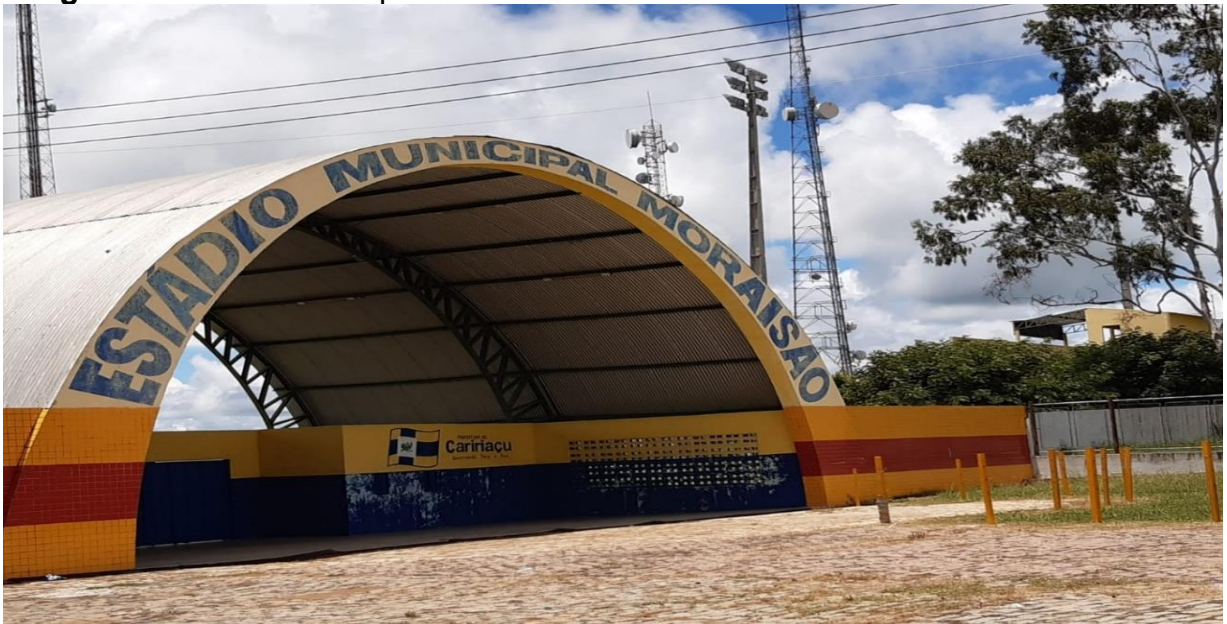
Imagem 5: Estádio Municipal Moraisão.