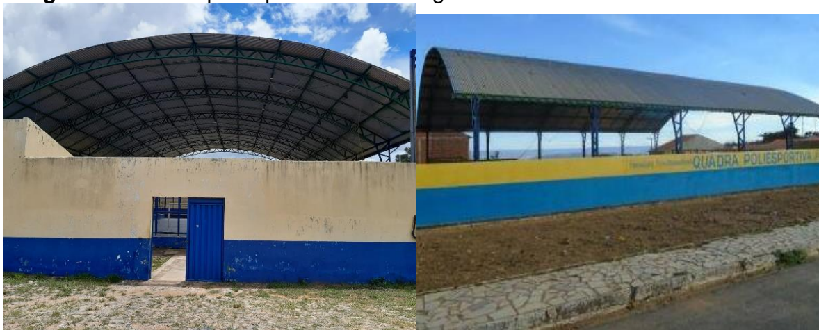
Imagens 8: Quadra poliesportiva Pedro Nogueira Machado

Fonte: Arquivo pessoal do autor, 2023. @viajando todo o brasil, 2023.