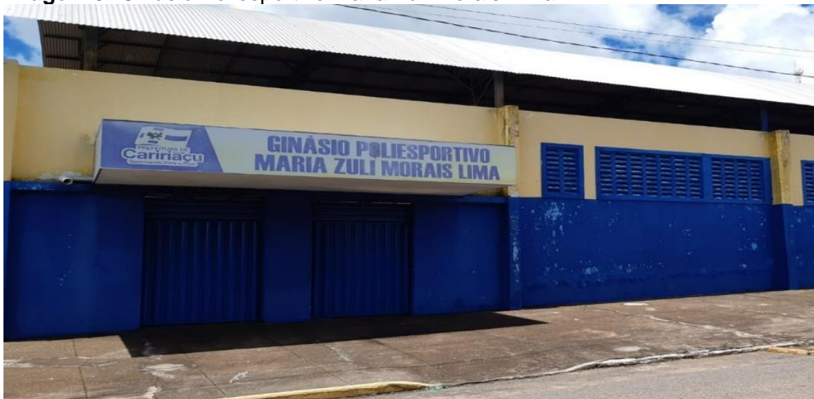
Imagem 9: Ginásio Poliesportivo Maria Zuli Moraes Lima.

O ginásio poliesportivo Maria Zuli Moraes Lima, localizada no Barrio paraíso na rua Maria Leite, inaugurada no dia 17 de junho 2016, o ginásio poliesportivo atualmente se encontra em situações bem conservada com iluminação, bancos para assentos (arquibancada), banheiros e bebedouro. O ginásio e localizado em uma rua de fácil acesso pouca movimentação, mais próxima à delegacia municipal.