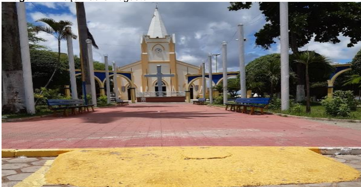
Imagem 2: Praça Padre Augusto