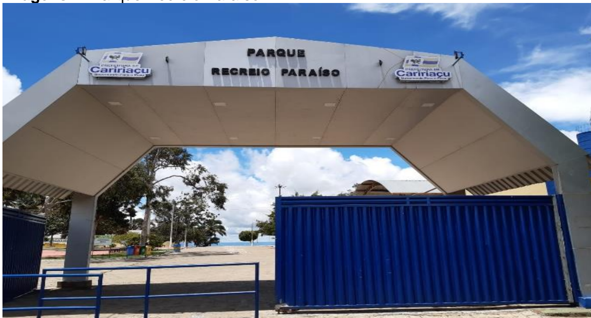
Imagens 4: Parque Recreio Paraíso