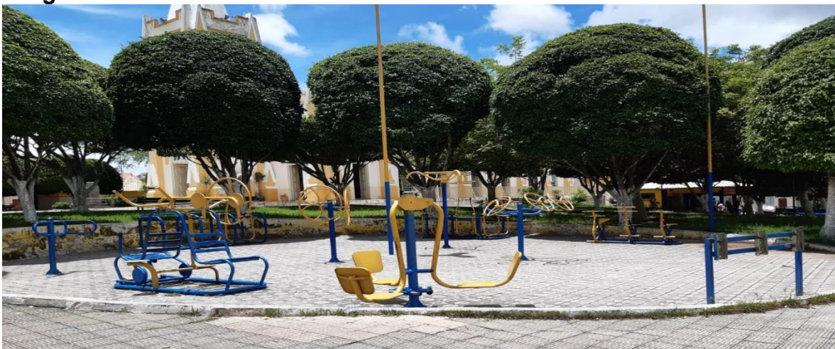
Imagem 6: Academia Pública

A academia popular está localizada em vários espaços na cede da cidade, mais a academia popular que fez parte da pesquisa e foi avaliada está localizada na praça Padre Augusto, no centro da cidade, a mesma foi inaugurada no dia 25 de outubro de 2019 pela as autoridades públicas.