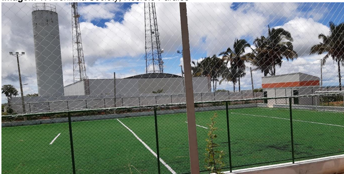
Imagem 1: Areninha Society, Recreio Paraíso

Essa areninha possui a área de Intervenção e urbanização de 1.200 m 2 , campo Society com grama sintética, alambrados, rede, vestiários com banheiros, torres de iluminação e acessos pavimentados, e é administrada pela secretaria de esporte do município, recebendo os protocolos sanitários de uso através da SEJUV.