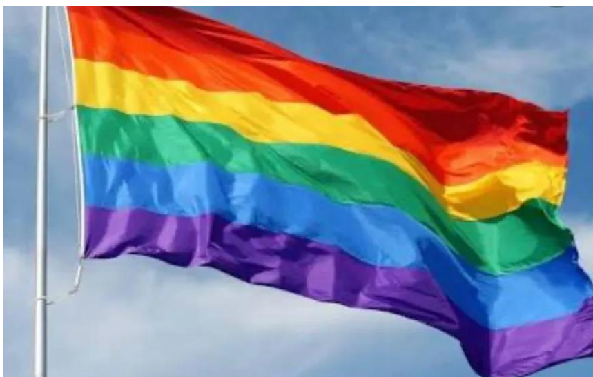
Bandeira LGBT.

A sigla LGBTQIAPN+ representa uma variedade de identidades de gênero e orientações sexuais, destacando a riqueza e a complexidade das vivências humanas. Aqui está o significado de cada letra: