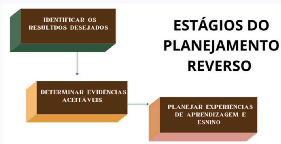
Figura 2 – Planejamento para compreensão: estágios do planejamento reverso

Compreende-se que para realizar um estudo sobre dadas práticas, primeiro se faz necessário ter uma percepção adequada de seus conceitos e aplicabilidades. Nesse propósito, a primeira unidade destina-se a apresentar o panorama geral da inclusão de pessoas com deficiência no ensino superior, assim como compreender as percepções docentes acerca do conceito e práticas inclusivas. Para tanto, utiliza-se do conceito de modelo de planejamento reverso proposto por Wiggins e McTigue (2019), o qual se dá por meio de abordagem em três estágios, quais sejam, identificar os resultados desejados, determinar evidências aceitáveis e planejar experiências de aprendizagem e ensino, como se vê na Figura 02.