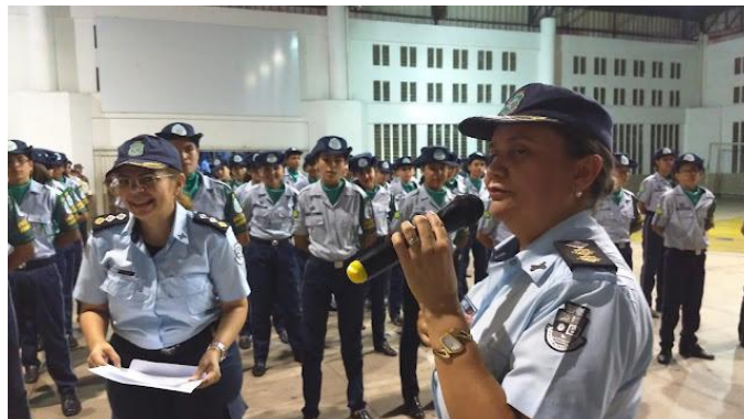
Figura 4: Solenidade de Lançamento do Pelotão Ambiental