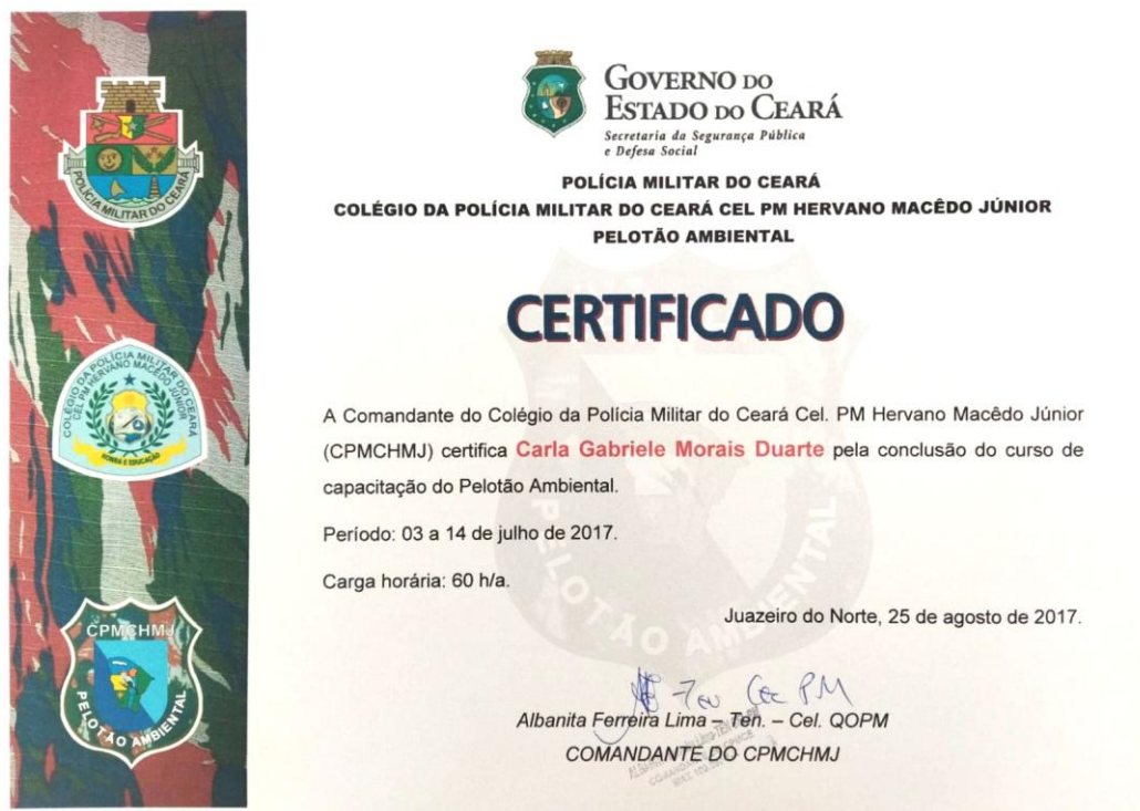
Figura 1: Certificado do Curso de Capacitação do PAM

O curso do Pelotão Ambiental é composto por diversos temas relevantes à educação e à preservação do meio ambiente. Conforme o sumário da apostila, os principais tópicos abordados incluem: noções de legislação ambiental, direitos da criança e do adolescente, educação ambiental, fiscalização ambiental, técnicas de primeiros socorros, prevenção ao uso indevido de drogas, técnicas de segurança em trilhas ecológicas, práticas e atividades comunitárias, e técnicas de oratória. Esses temas visam proporcionar conhecimentos integrados, promovendo a formação de cidadãos conscientes e engajados na preservação ambiental e na melhoria da qualidade de vida.