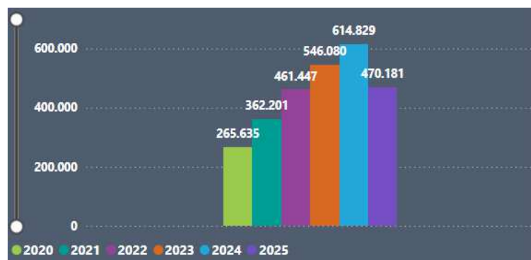
Gráfico 1 - Casos de violência doméstica julgados por ano, até 2025.

Segundo dados divulgados pelo Painel da Violência Contra a Mulher, do Conselho Nacional de Justiça (CNJ), foram registrados 1.347.801 processos de violência doméstica em tramitação. Sendo distribuído a quantidade de casos julgados, por ano, até setembro de 2025, da seguinte forma: