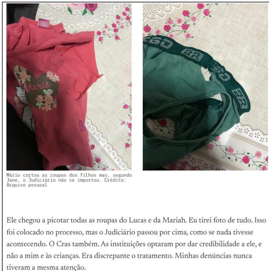
Figura 3: Matéria Jornalística