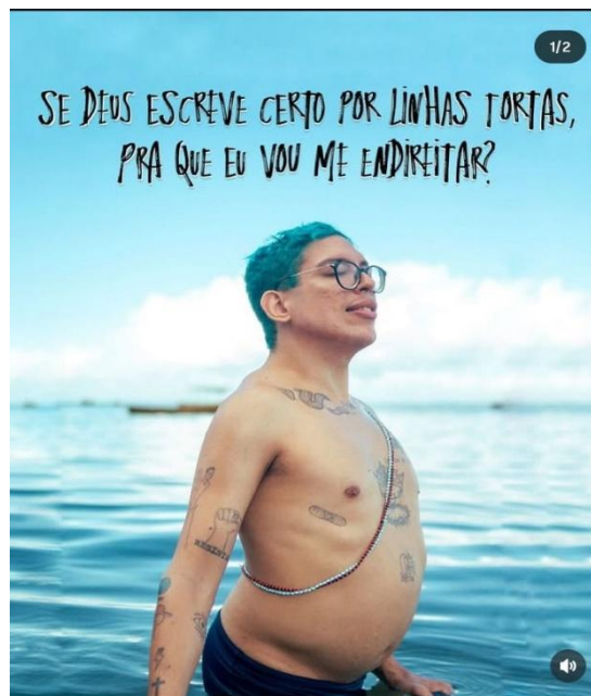
Imagem 01: busca por perfeição.