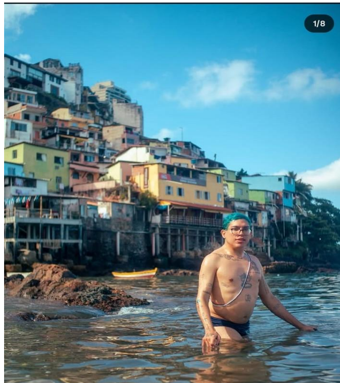
Imagem 02: autoconfiança e reconciliação com próprio corpo.