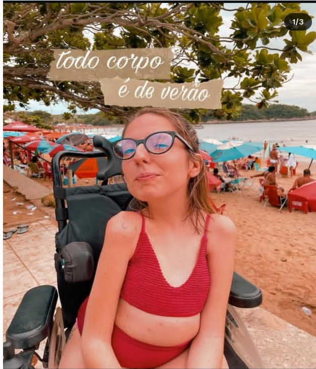
Imagem 03: valorização da diversidade corporal.